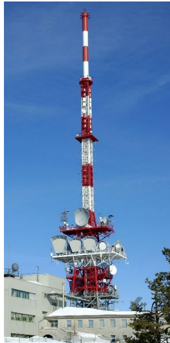
Sender Gaisberg, Sbg.

Hier geht's zum Bescheid der KommAustria